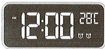
Réveil musical à LED